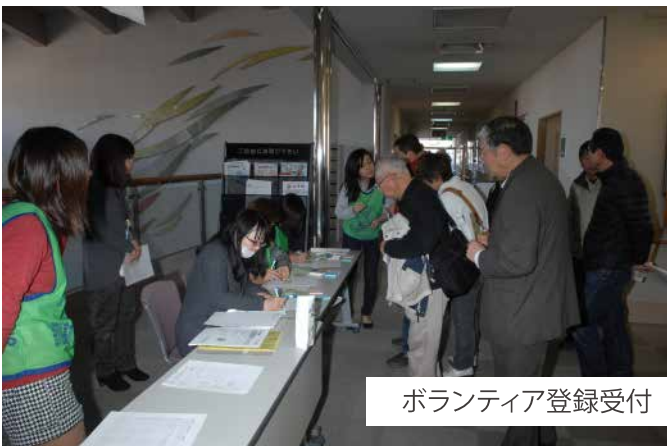
ボランティア登録受付

災害ボランティアネットワーク は、災害時に備え、日頃から「顔の見える関係」を築き、災害時に区民を支援することを目的とし、区民や地域団体が中心となり、行政関係機関と連携し、活動する住民主体の組織です。私たちが暮らす金沢区を“災害時に助け合える町”にするため、一緒に活動しませんか？